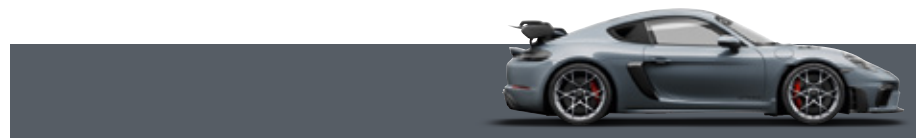
冰極灰 (Arctic Grey)