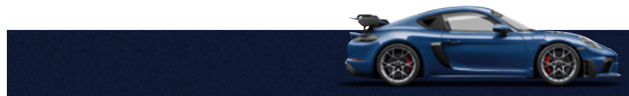
金屬龍膽藍 (Enzian Blue Metallic)