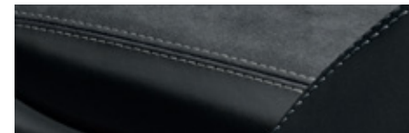
黑色搭配冰極灰 (Arctic Grey) 對比色縫線