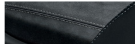
黑色搭配冰極灰 (Arctic Grey) 對比色縫線