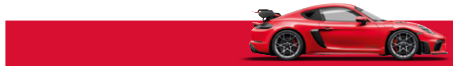
御林軍紅 (Guards Red)