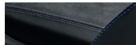
黑色搭配靜海藍 (Deep Sea Blue) 對比色縫線