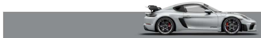
金屬 GT 銀 (GT Silver Metallic)