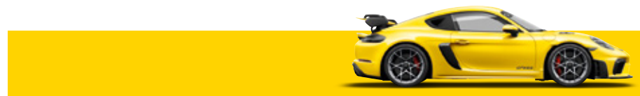
競速黃 (Racing Yellow)