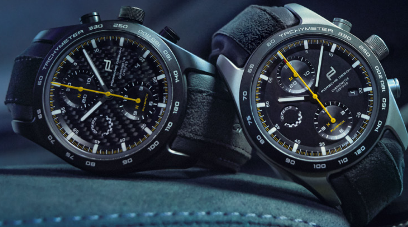
Chronograph 718 Cayman GT4 RS 配備魏薩套件 (Weissach Package)