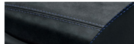
黑色搭配靜海藍 (Deep Sea Blue) 對比色縫線