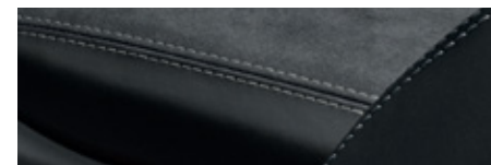
黑色搭配冰極灰 (Arctic Grey) 對比色縫線