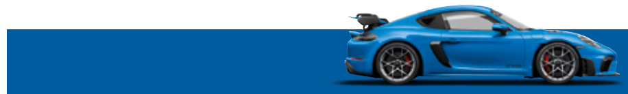
青鯊藍 (Shark Blue)