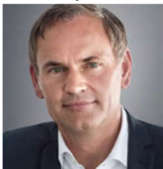
Oliver Blume Presidente de la Junta Ejecutiva