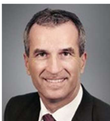
Albrecht Reimold Producción y Logística