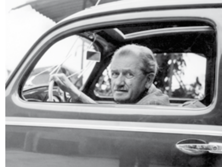
Ferdinand Porsche am Steuer eines Volkswagen, 1950