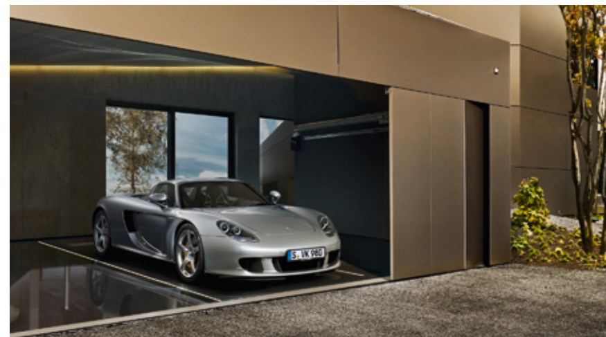
Carrera GT Modelljahre: 2003–2006, produzierte Einheiten: 1.270, verfügbare Teilenummern: 1.900

Porsche. Seit Modellgeneratio- nen Wegbereiter. Denn jedes Fahrzeug setzte in seiner Zeit Maßstäbe.