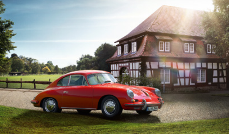
356 Modelljahre: 1950–1965, produzierte Einheiten: 77.766, verfügbare Teilenummern: 2.100