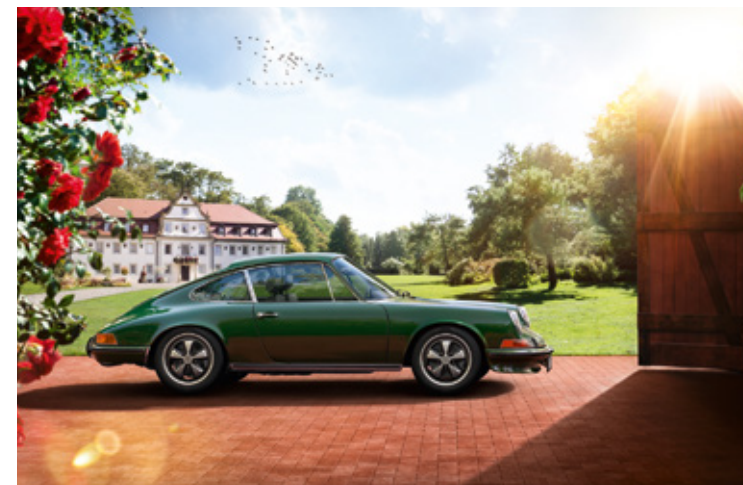
911 F Modelljahre: 1965–1973, produzierte Einheiten: 81.100, verfügbare Teilenummern: 3.500