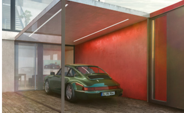
964 Modelljahre: 1989–1994, produzierte Einheiten: 63.762, verfügbare Teilenummern: 5.900