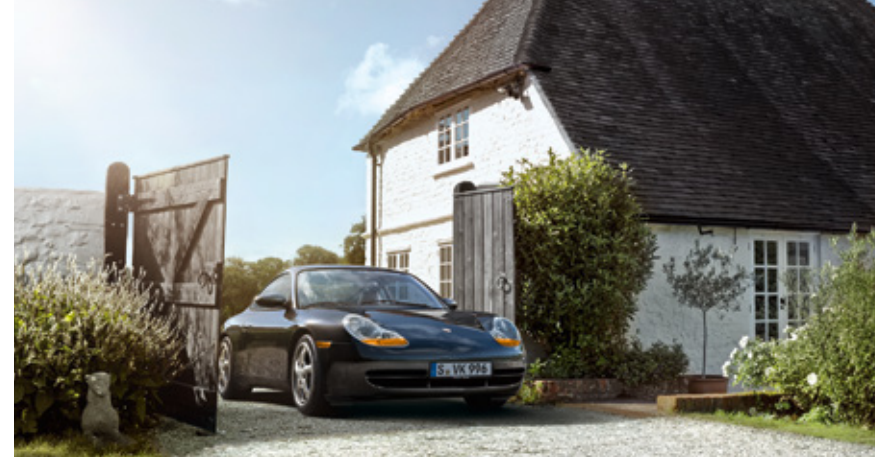
996 Modelljahre: 1998–2005, produzierte Einheiten: 175.262, verfügbare Teilenummern: 13.500