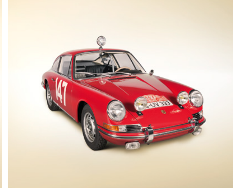
Abbildungen vorher/nachher: Porsche 901, Rallye Monte-Carlo, Modelljahr 1965

Um diesen Ansprüchen zu genügen und weltweit einen einheitlichen Qualitätsstandard bei allen Porsche Service- und Werkstattmitarbeitern zu gewährleisten, wurde ein spezielles Classic Trainings-