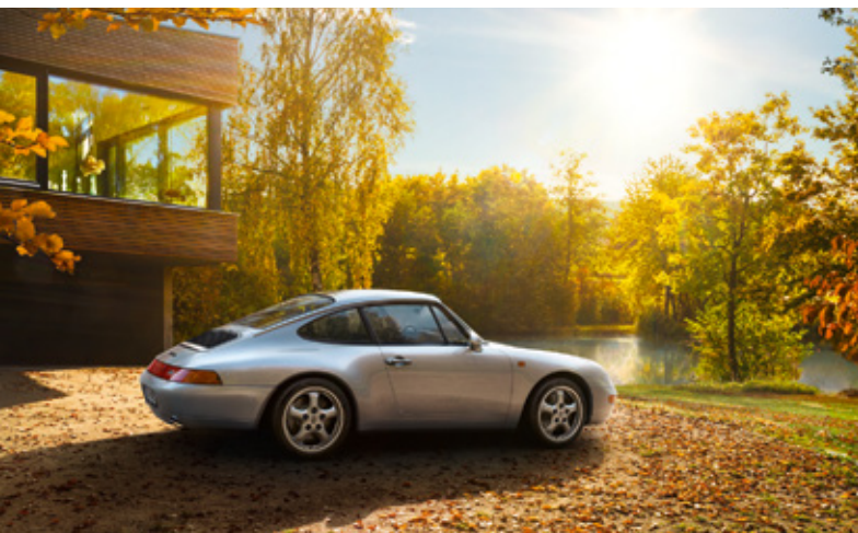
993 Modelljahre: 1994–1998, produzierte Einheiten: 68.881, verfügbare Teilenummern: 6.600