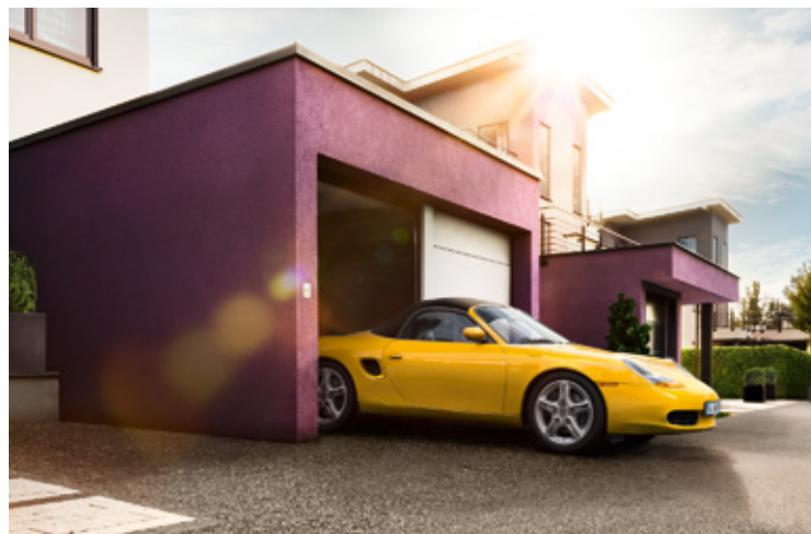
986 Modelljahre: 1997–2004, produzierte Einheiten: 164.874, verfügbare Teilenummern: 8.400