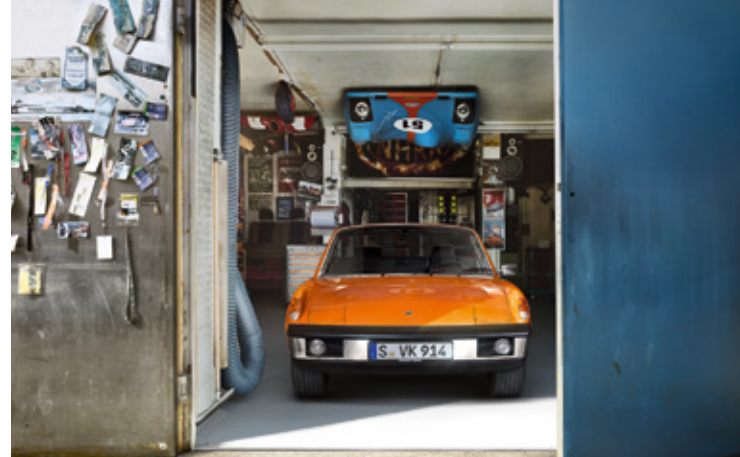
914 Modelljahre: 1970–1976, produzierte Einheiten: 118.982, verfügbare Teilenummern: 1.700