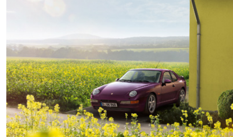
968 Modelljahre: 1992–1995, produzierte Einheiten: 11.248, verfügbare Teilenummern: 5.900