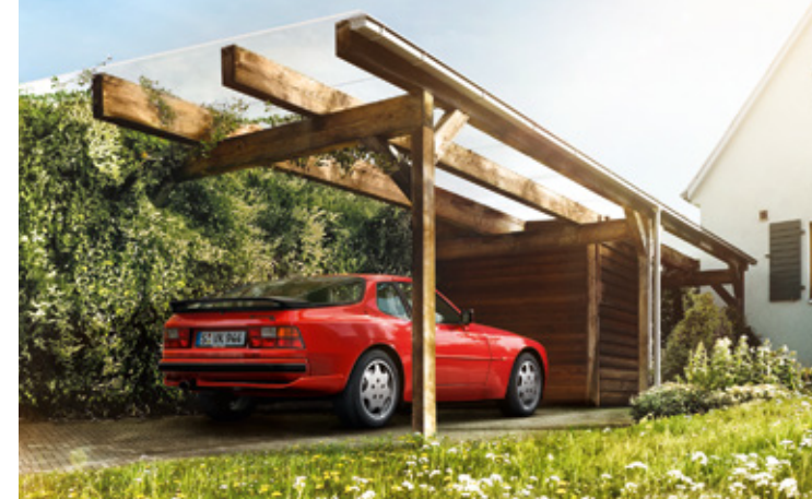
944 Modelljahre: 1982–1991, produzierte Einheiten: 163.302, verfügbare Teilenummern: 6.200