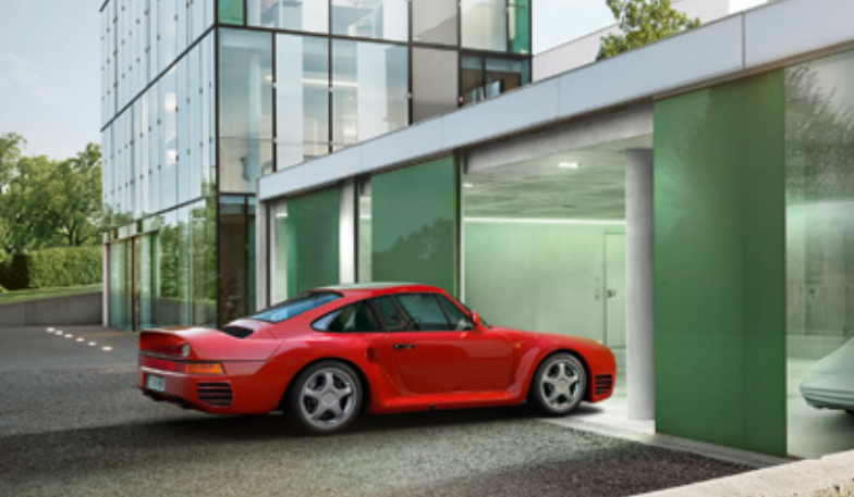
959 Modelljahre: 1987–1988, produzierte Einheiten: 292, verfügbare Teilenummern: 2.300