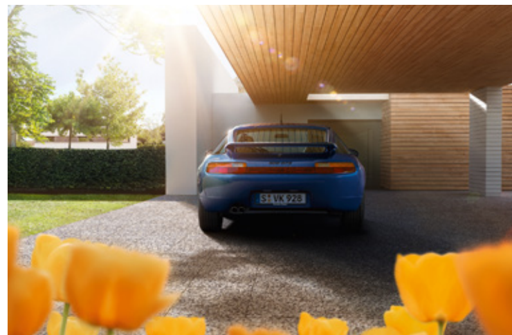
928 Modelljahre: 1978–1995, produzierte Einheiten: 61.056, verfügbare Teilenummern: 8.500