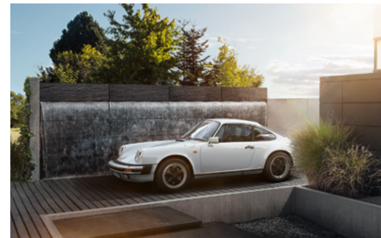
911 G Modelljahre: 1974–1989, produzierte Einheiten: 196.397, verfügbare Teilenummern: 7.100