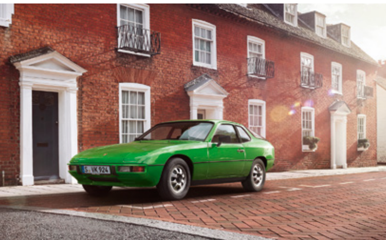
924 Modelljahre: 1976–1988, produzierte Einheiten: 150.684, verfügbare Teilenummern: 4.200