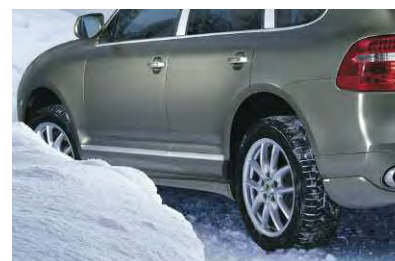
Des nouveaux venus qui arrivent à point nommé : chaînes neige spécialement adaptées aux différents modèles Porsche, tapis de sol en caoutchouc antidérapants et imperméables, jeu complet de roues hiver 19 pouces Cayenne Design