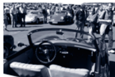
Bernd Woytal Pour la Club Coordination internationale de Porsche AG