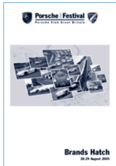
Brochure des événements du Porsche Club Great Britain, couverture