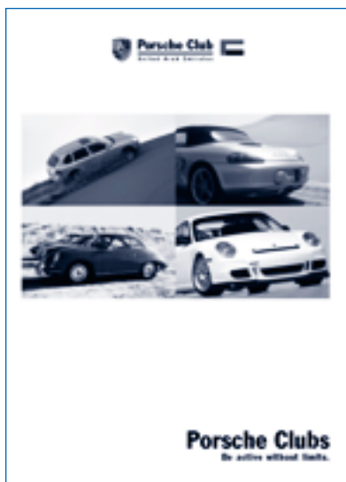
Brochure du Porsche Club United Arabian Emirates, couverture

côté du logo de votre Club, les photos et le texte de votre choix, comme vous pouvez le voir sur la brochure du Club Porsche United Arabian Emirates à la page 2. Résultat : vous disposez d'une véritable carte de visite pour votre Club, qui établit votre statut de Club Porsche officiellement reconnu, et que vous pourrez utiliser pour promouvoir la venue de nouveaux membres, notamment en présentant la brochure à l'occasion de manifestations ou dans des Centres Porsche. Ce support vous sera sans doute d'une aide très précieuse dans vos démarches pour trouver de nouveaux sponsors pour les événements organisés par votre Club.