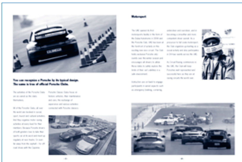
Brochure du Porsche Club United Arabian Emirates, page intérieure

côté du logo de votre Club, les photos et le texte de votre choix, comme vous pouvez le voir sur la brochure du Club Porsche United Arabian Emirates à la page 2. Résultat : vous disposez d'une véritable carte de visite pour votre Club, qui établit votre statut de Club Porsche officiellement reconnu, et que vous pourrez utiliser pour promouvoir la venue de nouveaux membres, notamment en présentant la brochure à l'occasion de manifestations ou dans des Centres Porsche. Ce support vous sera sans doute d'une aide très précieuse dans vos démarches pour trouver de nouveaux sponsors pour les événements organisés par votre Club.