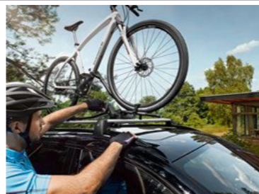
Nosač za bicikl