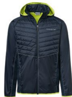
Vjetrovka-Mix-muška jakna Od 395,05 KM*