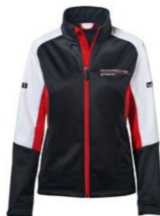
Softshell jakna - ženska Od KM 497,05 (uklj. PDV)*