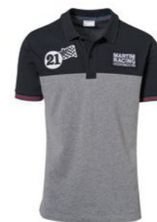
Polo majica – muška Od 157,70 KM*