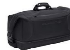
Putna torba Od 546,30 KM*