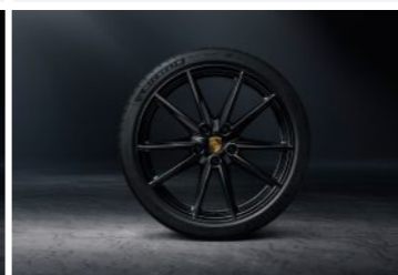
21" Carrera točak sa ljetnim pneumatikom u crnoj boji (visok sjaj)