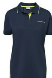
Polo majica-ženska Od 157,70 KM*