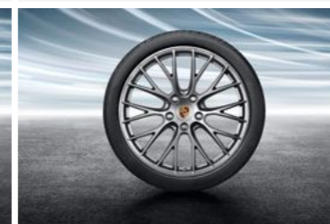
20" RS Spyder dizajn točak sa ljetnim pneumatikom