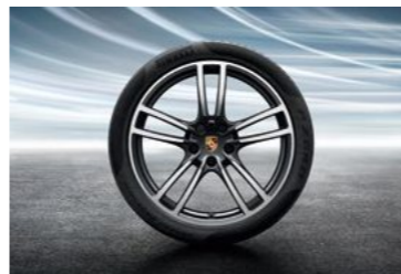
21" Cayenne Turbo točak sa ljetnim pneumatikom