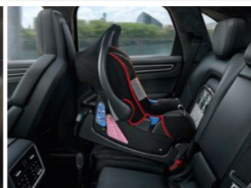
Dječije bebi sjedište ISOFIX, GO+