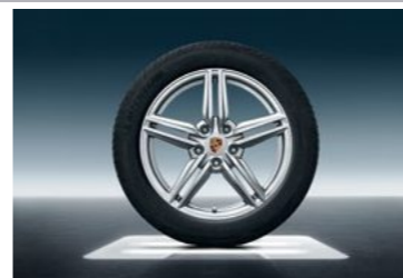
19" Cayenne dizajn II točak sa ljetnim pneumatikom