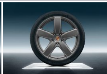
21" Cayenne Sport Classic točak sa ljetnim pneumatikom u boji platine (svilenkast sjaj)