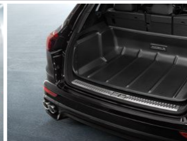
Zaštitna prostirka gepeka Od KM 378,00 (uklj. PDV)*