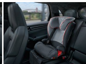
Junior Plus dječije sjedište ISOFIT, G2 + G3