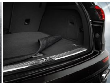
Dvostrana prostirka za gepek sa rubovima od imitacije kože Od KM 340,15 (uklj. PDV)*