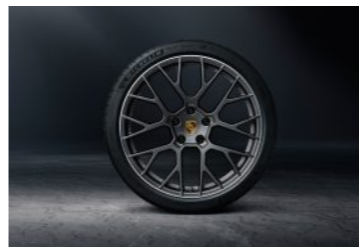
21" RS Spyder točak sa ljetnim pneumatikom