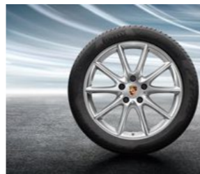
20" Cayenne dizajn točak sa ljetnim pneumatikom