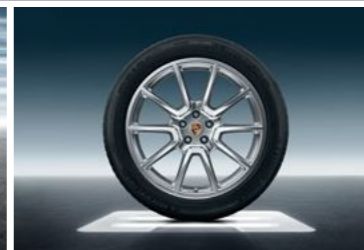
20" Macan Sport dizajn točak sa ljetnim pneumatikom