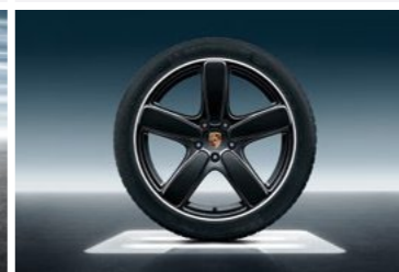
21" Sport Classic točak sa ljetnim pneumatikom u crnoj boji (visok sjaj)