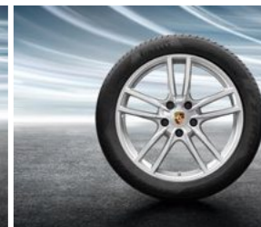
20" Cayenne Sport točak sa ljetnim pneumatikom