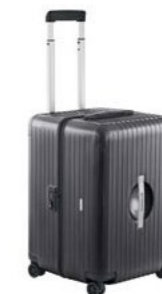
Ultra lak kofer XL Od 1.369,50 KM*