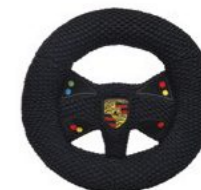
Motorsport plišani volan Od 72,30 KM*