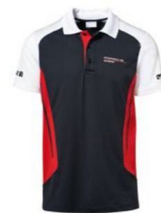
Polo majica - muška Od KM 157,70 (uklj. PDV)*