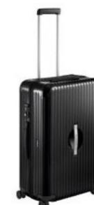
Ultra lak kofer XXL Od 1.544,10 KM*