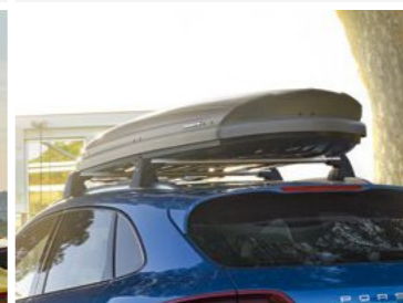
Krovni kofer 320, (srebrni) Od KM 1.860,70 (uklj. PDV)*