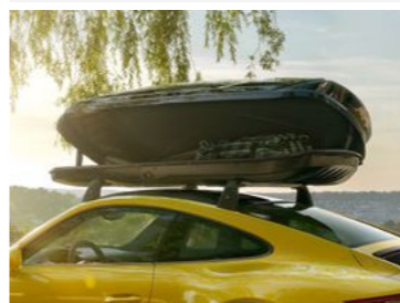
Krovni kofer 320, crna (visoki sjaj) Od KM 1.740,25 (uklj. PDV)*