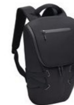
Ruksak Od 216,61 KM*