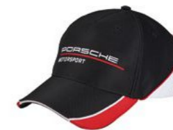
Bejzbol kačket Od KM 57,90 (uklj. PDV)*