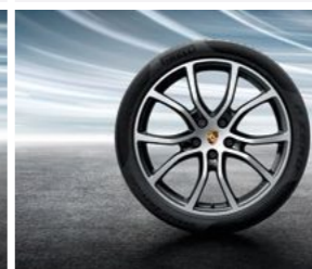
21" Cayenne Exclusive dizajn točak sa ljetnim pneumatikom u crnoj boji (visok sjaj)