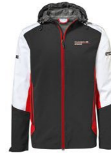
Windbreaker jakna - Unisex Od KM 377,30(uklj. PDV)*