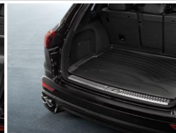
Zaštitna prostirka za gepek, niske strane Od KM 252,00 (uklj. PDV)*