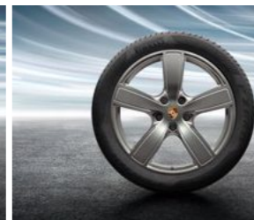
20" Cayenne Sport Classic sa ljetnim pneumatikom (visok sjaj)