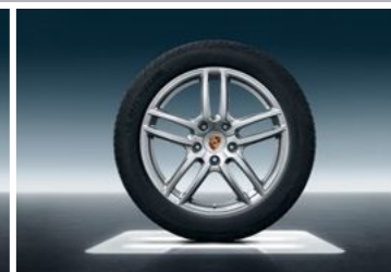
19" Cayenne Turbo točak sa ljetnim pneumatikom