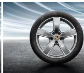
20" Cayenne Sport Classic točak sa ljetnim pneumatikom