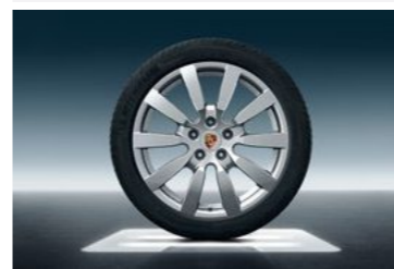
20" Cayenne Sport dizajn II točak sa ljetnim pneumatikom