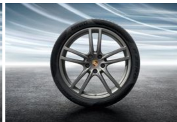
21" Cayenne Turbo dizajn točak sa ljetnim pneumatikom u boji platine (svilenkast sjaj)