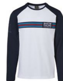
Muška majica dugih rukava Od 157,70 KM*