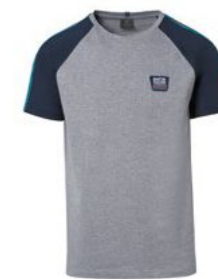
Muška majica Od 97,80 KM*