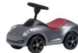
Dječiji Porsche 4S Od 271,95 KM*