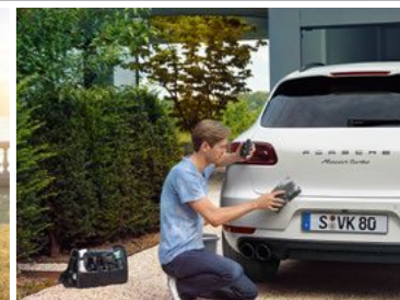
Torba za njegu vozila