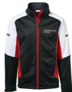
Softshell jakna – muška Od KM 497,05 (uklj. PDV)*