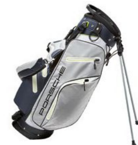
Golf torba Od 745,85 KM*