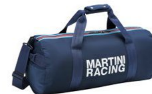
Sportska torba Od 246,95 KM*