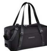
Putna torba Od 1.194,90 KM*