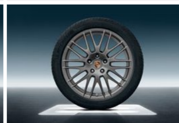
20" RS Spyder dizajn točak sa ljetnim pneumatikom u boji platine (svilenkast sjaj)