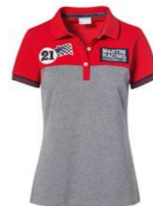
Polo majica – ženska Od 157,70 KM*