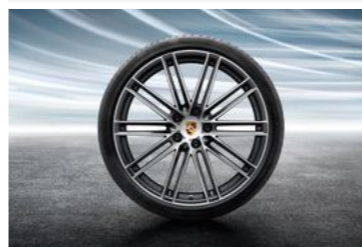
22" 911 Turbo dizajn točak sa ljetnim pneumatikom