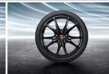
20" Carrera S točak sa ljetnim pneumatikom u crnoj boji (visok sjaj)