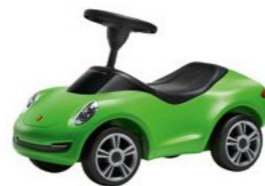
Dječiji Porsche 4S Od 271,90 KM*