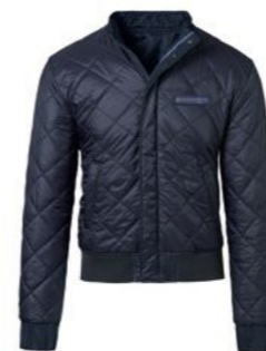
Dvostrana jakna – muška Od 626,25 KM