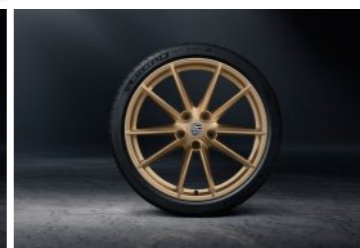
21" Carrera S točak sa ljetnim pneumatikom u zlatnoj boji (visok sjaj)