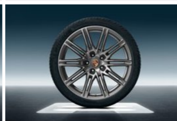
21" Cayenne Sport Edition točak sa ljetnim pneumatikom u boji platine (svilenkast sjaj)