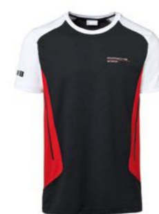
Majica kratkih rukava - muška Od KM 117,80 (uklj. PDV)*