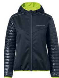
Jakna – ženska Od 337,31 KM*