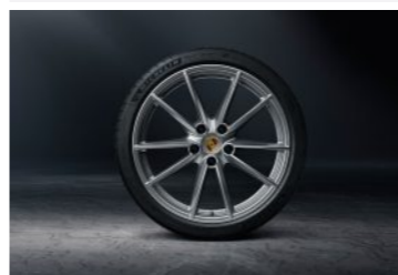
21" Carrera S točak sa ljetnim pneumatikom