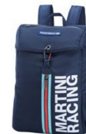
Ruksak Od 246,95 KM*