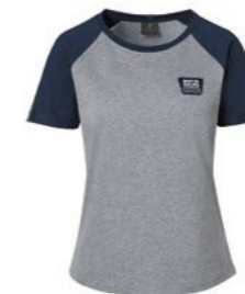
Ženska majica Od 97,80 KM*