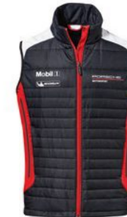
Prsluk - Unisex Od KM 337,35 (uklj. PDV)*