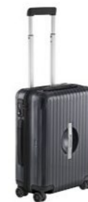
Ultra lak kofer M Od 1.120,05 KM*