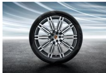
21" 911 Turbo dizajn točak sa ljetnim pneumatikom