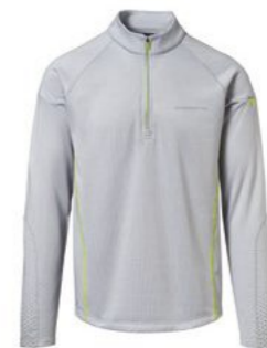
Majica dugih rukava – muška Od 197,60 KM*