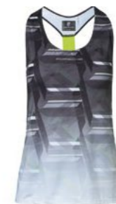
Bluza Od 97,80 KM*