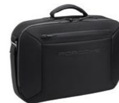
2 u 1 poslovna torba Od 446,55 KM*