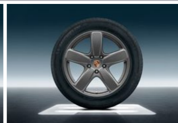
19" Cayenne Sport Classic točak sa ljetnim pneumatikom u boji platine (svilenkast sjaj)