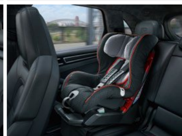
Dječije sjedište ISOFIX, G1