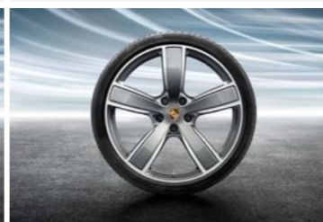
22" Cayenne sport Classic točak sa ljetnim pneumatikom