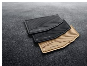
Podne prostirke za sva godišnja doba Od KM 321,30 (uklj. PDV)*