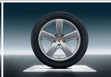
19" Cayenne Sport Classic točak sa ljetnim pneumatikom