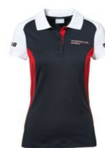
Polo majica – ženska Od KM 157,70 (uklj. PDV)*