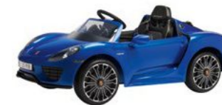
Dječiji 918 Spyder električni Od 1.194,90 KM*