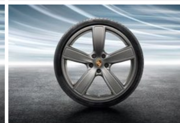
22" Cayenne Sport Classic točak sa ljetnim pneumatikom u boji platine (svilenkast sjaj)