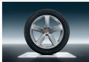
19" Sport Classic točak sa ljetnim pneumatikom