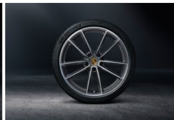
21" Carrera Classic točak sa ljetnim pneumatikom