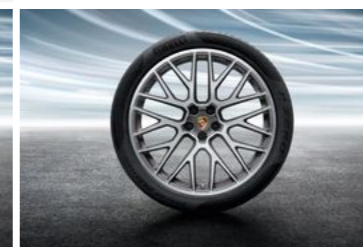
21" RS Spyder dizajn točak sa ljetnim pneumatikom