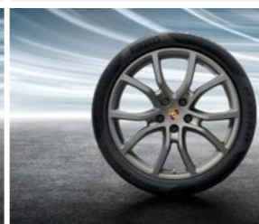
21" Cayenne Exclusive dizajn točak sa ljetnim pneumatikom u boji platine (svilenkast sjaj)