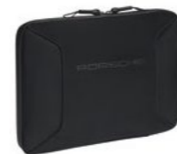
Torba za Laptop 13" Od 150,95 KM*