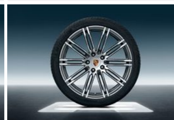
21" 911 Turbo dizajn točak sa ljetnim pneumatikom