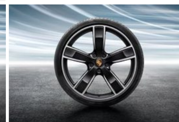
22" Cayenne Sport Classic točak sa ljetnim pneumatikom u crnoj boji (visok sjaj)