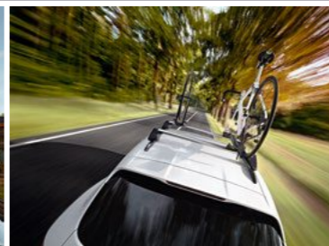
Nosač za trkački bicikl