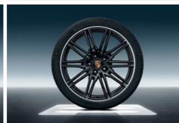
21" Cayenne Sport Edition točak sa ljetnim pneumatikom u crnoj boji (visok sjaj)