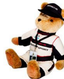
Motorsport plišani medo Od 421,55 KM*