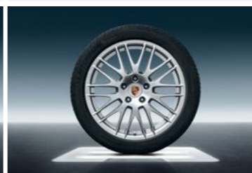
20" RS Spyder dizajn točak sa ljetnim pneumatikom