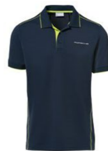
Polo majica-muška Od 157,70 KM*