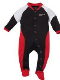
Motorsort kombinezon za bebe Od 97,80 KM*