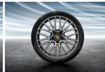
21" RS Spyder točak sa ljetnim pneumatikom