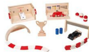
Trkačka staza set S Od 47,40 KM*