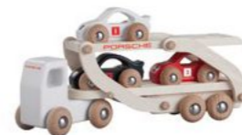
Porsche trkački kamion od drveta Od 172,10 KM*