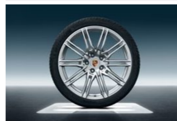
21" Cayenne Sport Edition točak sa ljetnim pneumatikom