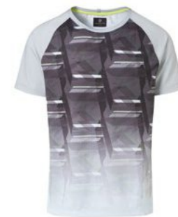
Majica-muška Od 117,80 KM*