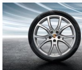
21" Cayenne Exclusive dizajn točak sa ljetnim pneumatikom