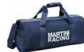
Valjkasta putna torba Od 246,95 KM (sa PDV-om)