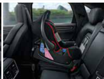
Dječija Baby sjedalica ISOFIX, G0+