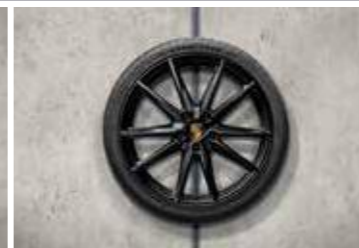
20"/-/21" Carrera S ljetni set točkova sa pneumaticima, u crnoj boji (satenski sjaj)