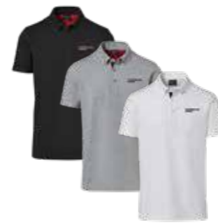
Polo majica* Od 117,80 KM (sa PDV-om)