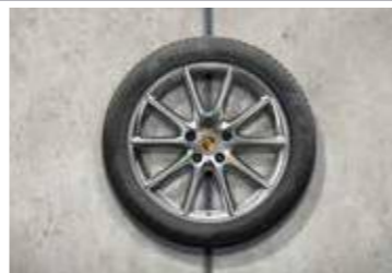
20" Cayenne Design ljetni set točkova sa pneumaticima