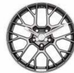
Zidni točak sat Od 3741,75 KM (sa PDV-om)