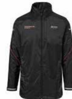
Jakna vjetrovka – Unisex Od 377,30 KM (sa PDV-om)