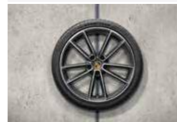
20"/-/21" Carrera Classic ljetni set točkova sa pneumaticima