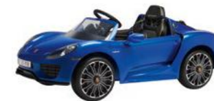
Dječiji 918 Spyder električni automobil Od 1194,90 KM (sa PDV-om)