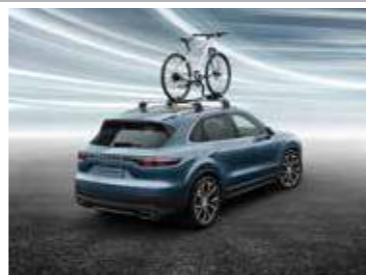
Nosač za bicikl