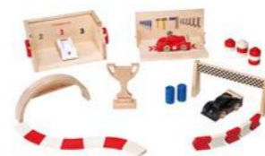
Trkačka staza – set Od 246,90 KM (sa PDV-om)