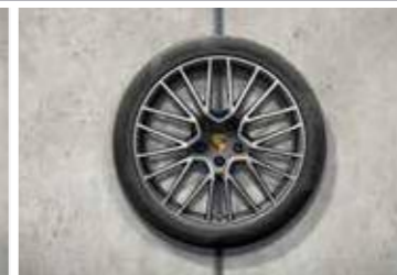
21" RS Spyder ljetni set točkova sa pneumaticima