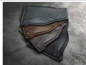
Podne prostirke za sva godišnja doba Od 321,30 KM (sa PDV-om)*