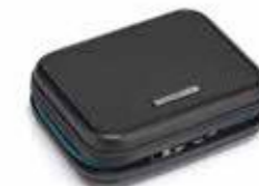
Višenamjenska futrola Od 150,95 KM (sa PDV-om)