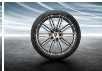
21" 911 Turbo Design ljetni set točkova sa pneumaticima