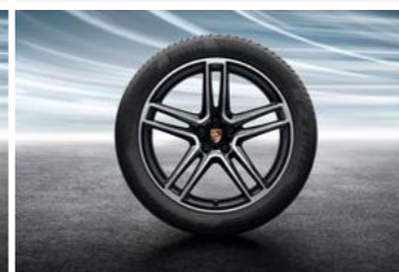
20" Macan Turbo ljetni set točkova sa pneumaticima, u crnoj boji (visoki sjaj)