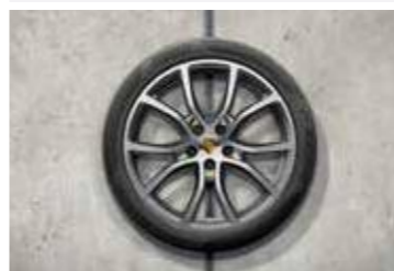
21" Cayenne Exclusive Design ljetni set točkova sa pneumaticima