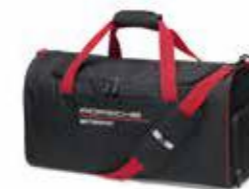
Sportska torba Od 129,10 KM (sa PDV-om)