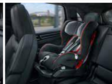
Dječija Junior ISOFIX, G1