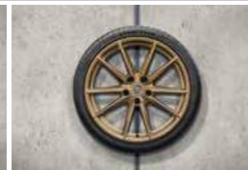
20"/-/21" Carrera S ljetni set točkova sa pneumaticima, u Aurum boji (satenski sjaj)