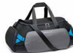
Sportska torba Od 260,40 KM (sa PDV-om)