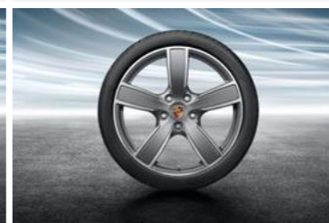
20" Sport Classic točkovi sa ljetnim pneumaticima