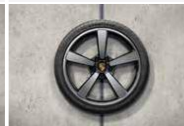
20"/-/21" Carrera Exclusive Design ljetni set točkova sa pneumaticima, u crnoj boji (visoki sjaj)