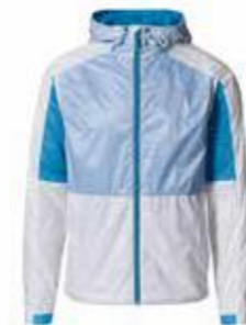
Ultra lagana jakna Od 357,35 KM (sa PDV-om)