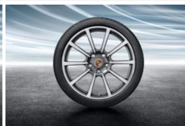
20" Carrera Classic ljetni set točkova sa pneumaticima