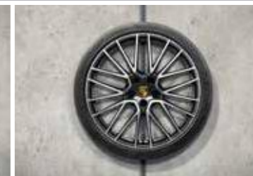
22" RS Spyder Design ljetni set točkova sa pneumaticima