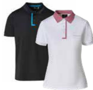
Polo majica* Od 157,70 KM (sa PDV-om)