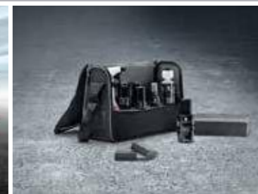
Torba za njegu vozila