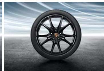
20" Carrera S ljetni set točkova sa pneumaticima, u crnoj boji (visoki sjaj)