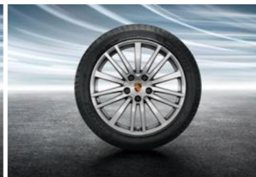
20" Panamera dizajn kompletni ljetni set točkova