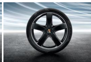
21" Sport Classic ljetni set točkova sa pneumaticima, u crnoj boji (visoki sjaj)