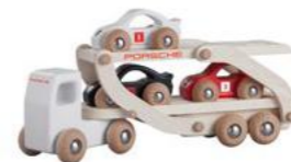
Drveni trkački kamion Od 172,10 KM (sa PDV-om)