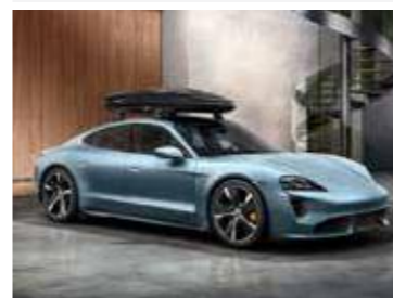
Krovni kofer 320, crna boja (visoki sjaj) Od 1.740,20 KM (sa PDV-om)*