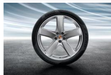
21" Sport Classic ljetni set točkova sa pneumaticima