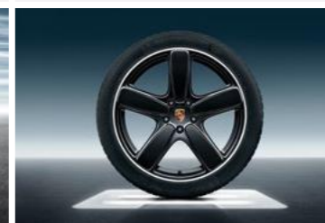
21" Sport Classic ljetni set točkova sa pneumaticima, u crnoj boji (visoki sjaj)