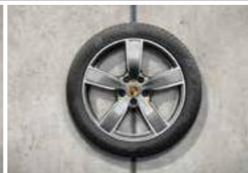
20" Cayenne Sport Classic ljetni set točkova sa pneumaticima