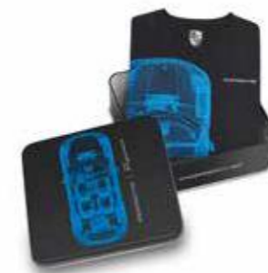
Kolekcionarska majica No. 16 Od 97,80 KM (sa PDV-om)