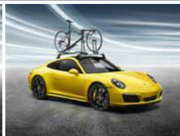
Nosač za trkački bicikl