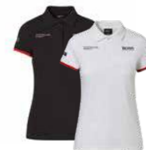
Polo majica – Ženska Od 157,70 KM (sa PDV-om)