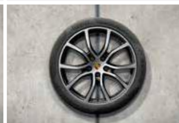
21" Cayenne Exclusive Design ljetni set točkova sa pneumaticima, u crnoj boji (visoki sjaj)