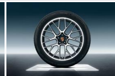
20" RS Spyder Design ljetni set točkova sa pneumaticima