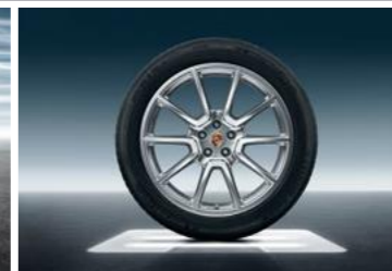
20" Macan SportDesign ljetni set točkova sa pneumaticima