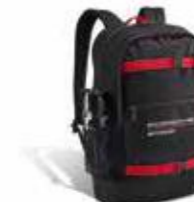
Ruksak Od 107,20 KM (sa PDV-om)

*Dostupno u specifičnim muškim i ženskim verzijama