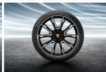
21" Exclusive Design ljetni set točkova sa pneumaticima, u crnoj boji (visoki sjaj)