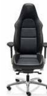
Prilagodljiva uredska stolica Od 13256,20 KM (sa PDV-om)