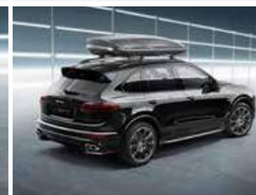
Krovni kofer 520, boja platine Od 2.101,60 KM (sa PDV-om)*