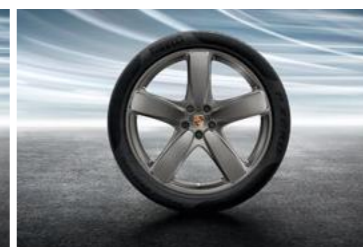
21" Sport Classic ljetni set točkova sa pneumaticima, u boji platine (satenski sjaj)