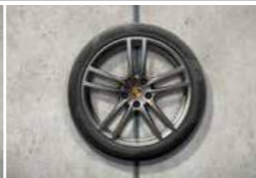
21" Cayenne Turbo Design ljetni set točkova sa pneumaticima, u boji platine (satenski sjaj)