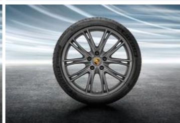
21" Exclusive Design ljetni set točkova sa pneumaticima, u boji platine (satenski sjaj)