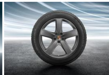
19" Sport Classic ljetni set točkova sa pneumaticima, u boji platine (satenski sjaj)