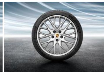
21" Panamera SportDesign ljetni set točkova sa pneumaticima