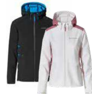
Jakna* Od 796,50 KM (sa PDV-om)