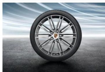
20" 911 Turbo ljetni set točkova sa pneumaticima