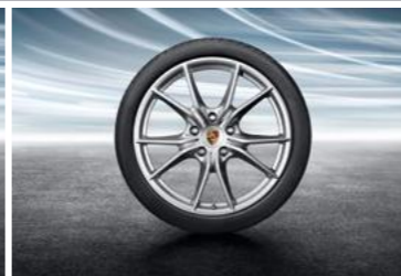
20" Carrera S ljetni set točkova sa pneumaticima