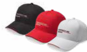
Kačket – Unisex Od 57,90 KM (sa PDV-om)