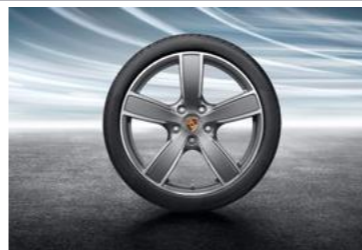
20" Sport Classic točkovi sa ljetnim pneumaticima