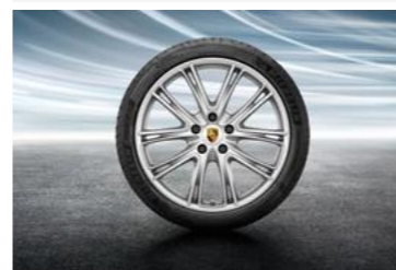
21" Exclusive Design ljetni set točkova sa pneumaticima