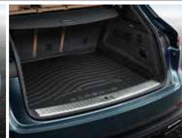
Zaštitna prostirka za gepek sa niskim stranama Od 252,00 KM (sa PDV-om)*