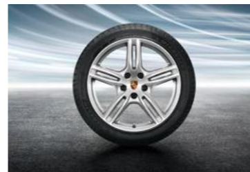
20" Panamera Turbo ljetni set točkova sa pneumaticima