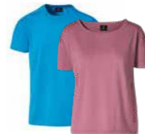
Majica sa kratkim rukavima* Od 117,80 KM (sa PDV-om)