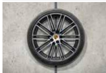
22" 911 Turbo Design ljetni set točkova sa pneumaticima