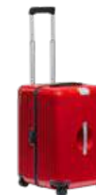
PTS Multiwheel® Ultralight izdanje 2.0, XL* Od 1918,30 KM (sa PDV-om)