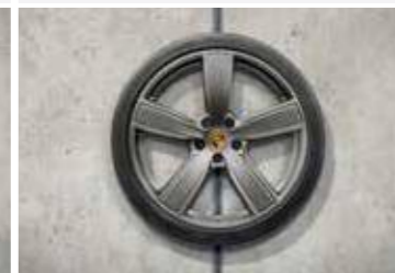
22" Cayenne Sport Classic ljetni set točkova sa pneumaticima, u boji platine (satenski sjaj)