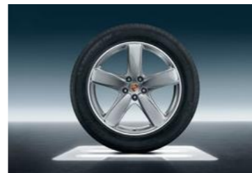
19" Sport Classic ljetni set točkova sa pneumaticima