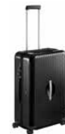
PTS Multiwheel® Ultralight izdanje 2.0, XXL* Od 1793,85 KM (sa PDV-om)