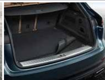
Dvostrana prostirka za gepek sa rubovima od imitacije kože Od 340,10 KM (sa PDV-om)*