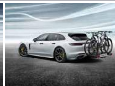
Stražnji nosač za bicikl