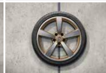
20"/-/21" Carrera Exclusive Design ljetni set točkova sa pneumaticima, u Aurum boji (satenski sjaj)