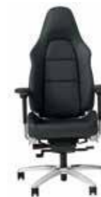
Uredska stolica Od 10550,85 KM (sa PDV-om)