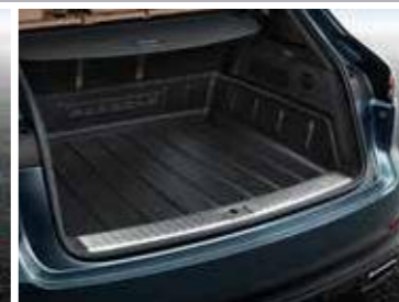
Zaštitna prostirka za gepek sa visokim stranama Od 377,95 KM (sa PDV-om)*