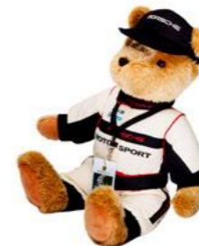
Motorsport plišani medo Od 197,10 KM (sa PDV-om)