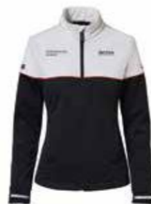
Softshell jakna – Ženska Od 497,05 KM (sa PDV-om)