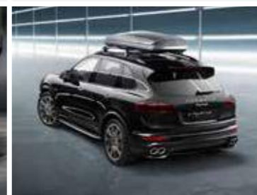
Krovni kofer 320, boja platine Od 1.860,70 KM (sa PDV-om)*