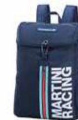
Ruksak Od 246,95 KM (sa PDV-om)