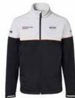
Softshell jakna – Muška Od 497,05 KM (sa PDV-om)