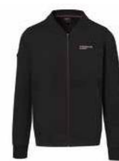
Softshell jakna – Muška Od 279,50 KM (sa PDV-om)