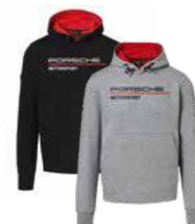
Dukserica – Muška Od 189,60 KM (sa PDV-om)