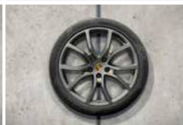
21" Cayenne Exclusive Design ljetni set točkova sa pneumaticima, u boji platine (satenski sjaj)