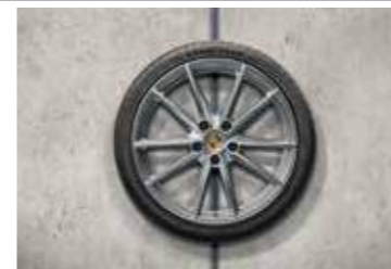
20"/-/21" Carrera S ljetni set točkova sa pneumaticima