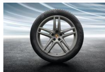
20" Macan Turbo ljetni set točkova sa pneumaticima, u boji platine (satenski sjaj)