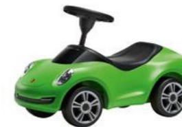
Dječiji Porsche 4S, lizard zelena Od 271,95 KM (sa PDV-om)