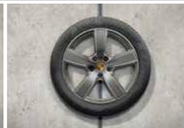
20" Cayenne Sport Classic ljetni set točkova, u boji platine (visoki sjaj)