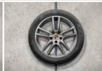
20" Cayenne Sport ljetni set točkova sa pneumaticima