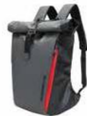
Ruksak Od 282,25 KM (sa PDV-om)