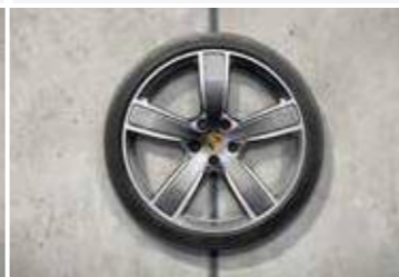
22" Cayenne Sport Classic ljetni set točkova sa pneumaticima