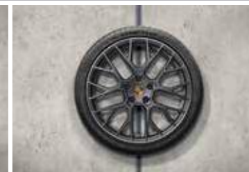
20"/-/21" RS Spyder Design ljetni set točkova sa pneumaticima