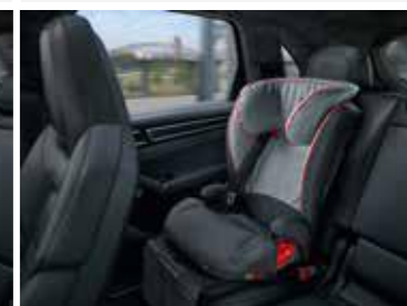
Dječija Junior Plus sjedalica ISOFIX, G2 + G3