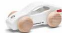
Drveni automobil Taycan Od 47,40 KM (sa PDV-om)