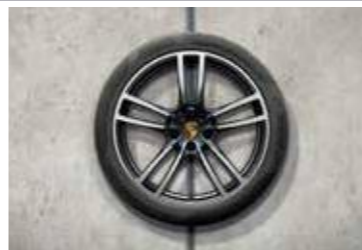
21" Cayenne Turbo ljetni set točkova sa pneumaticima