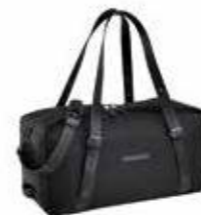
Weekender torba uklj. Kozmetičku torbu Od 1194,90 KM (sa PDV-om)