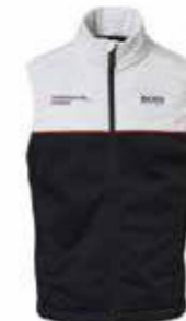
Prsluk – Unisex Od 337,35 KM (sa PDV-om)