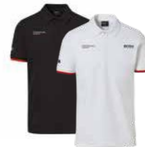
Polo majica – Muška Od 157,70 KM (sa PDV-om)