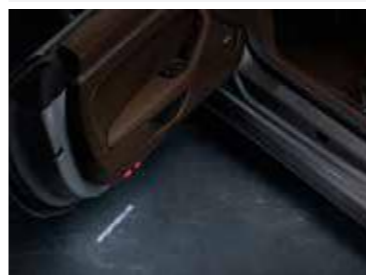
Unutrašnja LED svjetla na vratima sa 'PORSCHE' logom