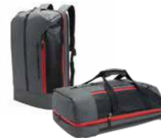
Putna torba 2 u 1 Od 391,65 KM (sa PDV-om)