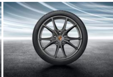
20" Carrera S ljetni set točkova sa pneumaticima, u boji platine (mat saten)