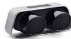
911 Zvučnik Od 1369,50 KM (sa PDV-om)