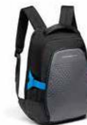
Ruksak Od 216,60 KM (sa PDV-om)