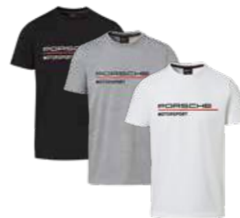
Majica sa kratkim rukavima* Od 77,85 KM (sa PDV-om)