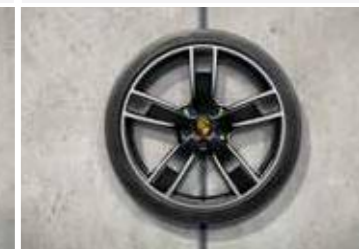
22" Cayenne Sport Classic ljetni set točkova sa pneumaticima, u crnoj boji (visoki sjaj)