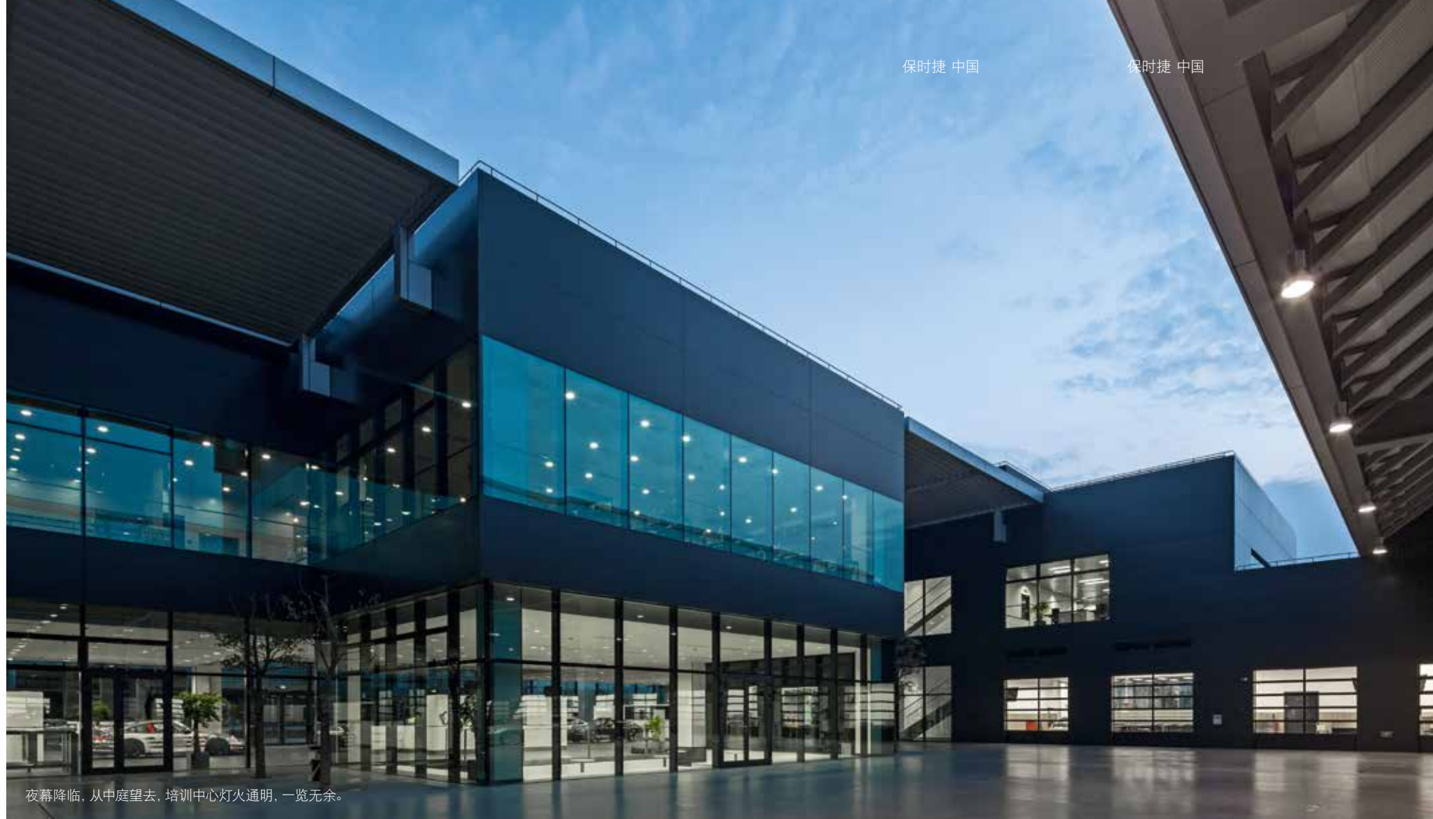
夜幕降临，从中庭望去，培训中心灯火通明，一览无余。