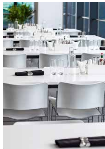
可容纳 160 个座位的餐厅可以让代表们深入体验 Porsche 生活方式。

训用车提供了宽敞通风的泊车区域。从大楼内部的各个角落，来此培训的学员都能透过无处不在的落地窗一眼望见中庭里那些熠熠生辉的 Porsche 跑车。这是一种无声却极具震撼力的设计语言，能在不经意的一瞥间激起每一个人心中对跑车以及其背后辉煌历史的热爱。