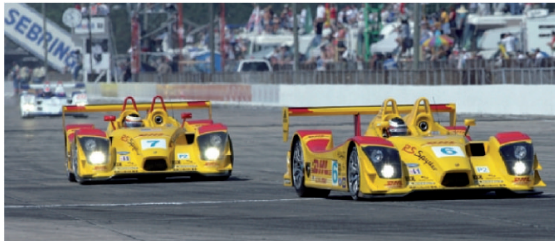
▲ Sebring 12小时耐力赛: Porsche RS Spyder