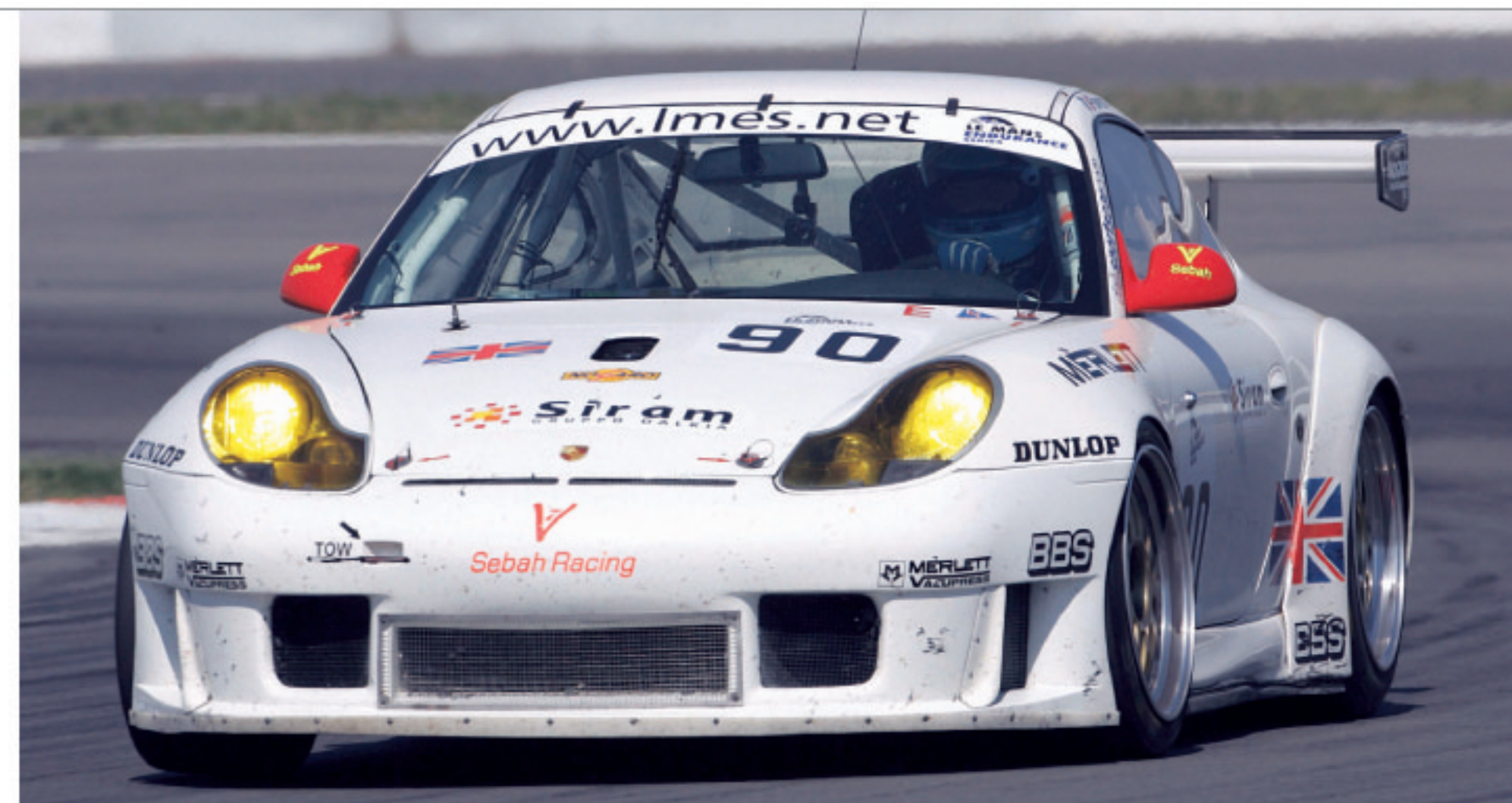
▲ GT2级别中的统治地位: 2005勒芒耐力系列赛中的911 GT3 RSR

911 GT3 RSR是近年来GT2级别中处于统治地位的车型。在2006赛季,众多的私人Porsche车队将驾驶这款车,续写与更强大的竞争对手成功较量的辉煌历史篇章。私人Porsche车队已在2006 ALMS赛季的前几项赛事中获得了良好的开端。■