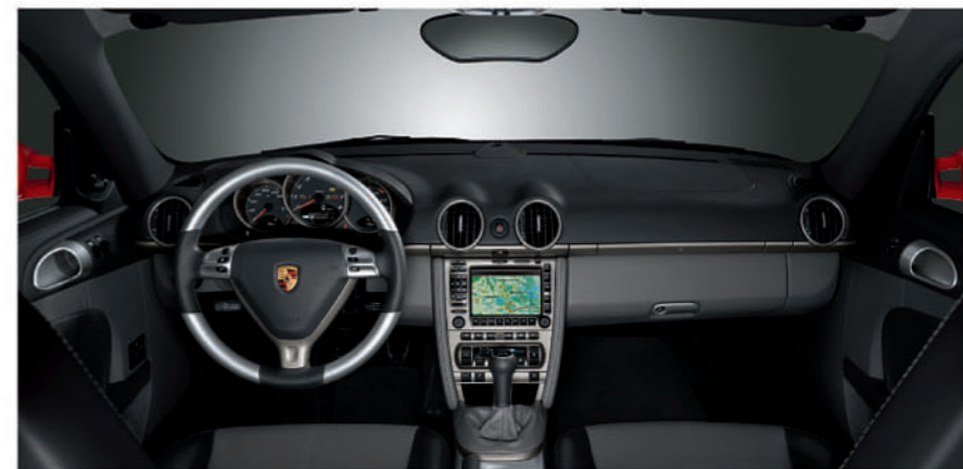
▲ Cayman仪表盘及可选配置，如带双色调组合的真皮内饰组件、Porsche通讯管理系统（PCM）、带AirLook饰件的三辐多功能方向盘

性。前行李箱宽大实用，后行李箱则被分隔为两个大容积储物区并采用顶置铰接后盖。总之，每款车型都将日常实用性、超凡的主动安全性以及毫不妥协的行驶性能独特地融合在一起。这些明显对立的方面成功地融入了一个经过验证的完美的车辆概念之中，并在路面上得到理想的展现。新款Cayman和Cayman S。Instantly Porsche。■