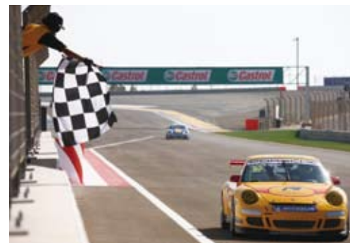
追星车队，第12回合（巴林赛车场）