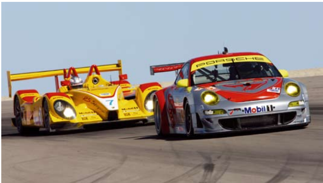
保时捷GT3 RSR和RS Spyder在美国盐湖城赛道（美国勒芒系列赛2008赛季）