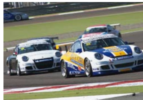
捷成车队，第12回合（巴林赛车场）