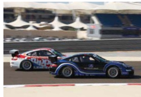
百得利车队（前）和格鲁普艾姆车队（后），第12回合（巴林赛车场）

http://www.porsche.com/china/zh/motorsportandevents/porshecarreracupasia/