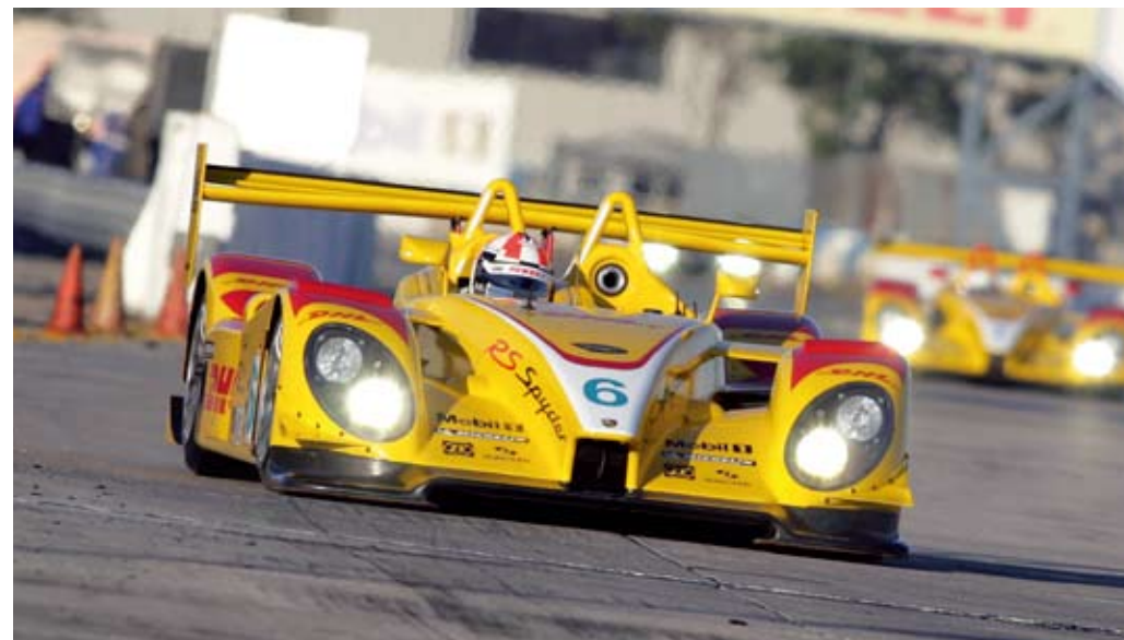
保时捷RS Spyder在美国赛百灵赛道（美国勒芒系列赛2008赛季）

美国勒芒系列赛在拉古纳-塞卡赛道的最后一场比赛以最激动人心的方式结束，保时捷近年来连胜的势头丝毫未减，一举囊括了LMP2和GT2级别的车手、车队和制造商冠军。