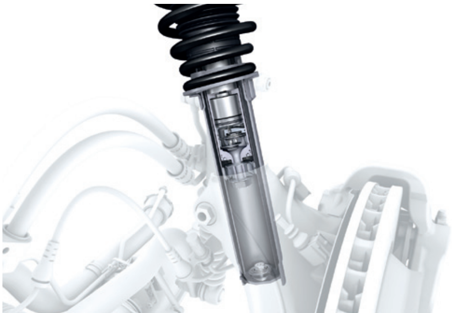
保时捷主动悬挂管理系统