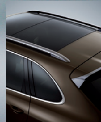
后扰流板边缘，车窗边沿，以及车顶行李架均可喷涂经典银金属漆

为进一步加强 Cayenne 运动风范，使其更加卓然出众，可采用侧裙板、高光漆饰或双氙气大灯等配置。通过 20 英寸 Cayenne SportDesign II 车轮以及车轮中心的全彩保时捷盾徽，喷薄而出的澎湃动力与自如灵动的性能一目了然。事实上，保时捷独家配件让每位车主都可以尽情发挥想象，为他们的 Cayenne 打造出气魄不凡的外观造型。