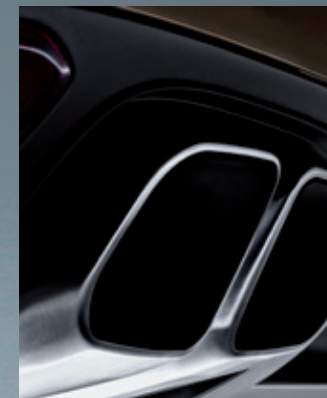
抛光铝材制成的运动型双尾管