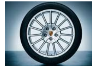
21英寸Cayenne SportDesign车轮为Cayenne GTS提供了堪称典范的道路行驶性能

若车主经常在路况较差的条件下驾车行驶，或者希望他们的Cayenne在越野路面上表现出丝毫不亚于公路行驶时的优良性能，小号车轮无疑是更为理想的选择。正如越野赛跑运动员喜欢