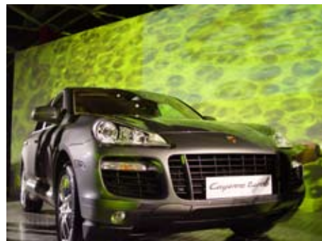
青岛银海国际游艇俱乐部：新款 Cayenne 系列震撼登场。