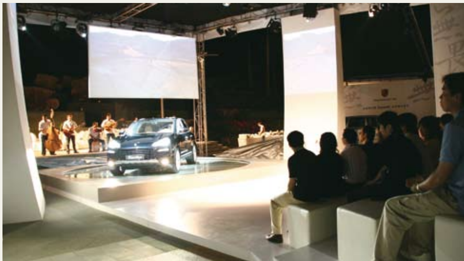
新款 Cayenne 系列在充满悬念的过程中揭开了面纱。

到狂喜，当疑惑化为赞誉，新款 Cayenne 系列反客为主，挑战着人们的想象力。