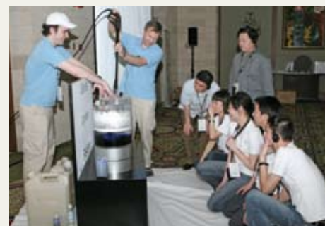
新款燃油直喷技术（DFI）的奥秘令参加培训的保时捷工作人员好奇不已。