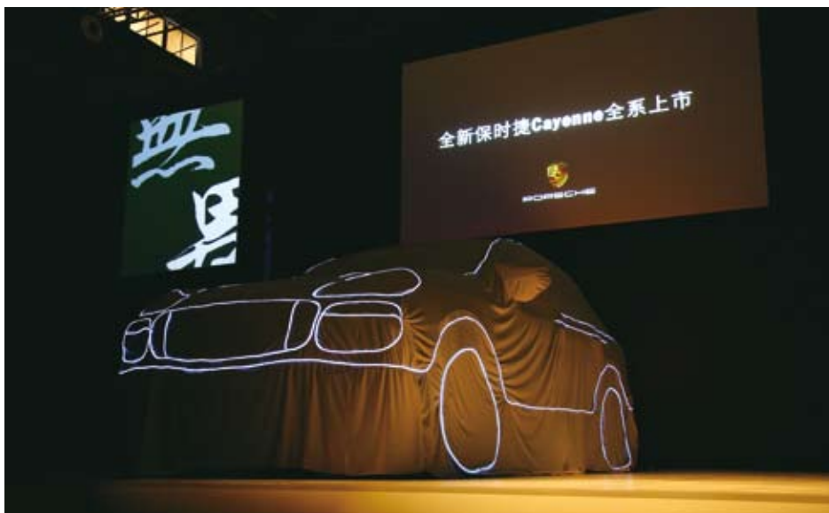
上海城市雕塑中心：LED 发光条勾勒出了新款 Cayenne 系列在设计 and 品质上的提升。

14 个城市在同一天举办新车上市活动，这在国内汽车行业来讲，是个罕见的创举。14 个如此大规模的发布活动能够取得相同的成功，更是堪称奇迹，令人惊叹不已。因此，同新款 Cayenne 系列的“无畏 无极”的品牌精神一样，这一系列活动本身就是一次“无畏 无极”的尝试——无论是盛大的规模，还是这一大胆的创新。