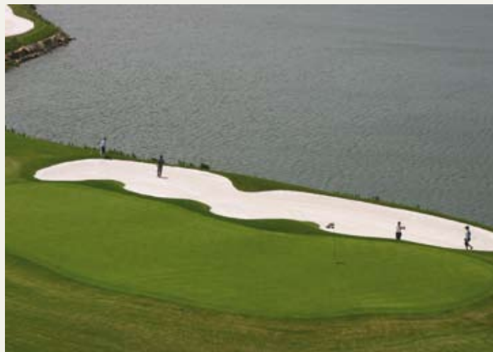
高尔夫爱好者的热土

九龙山马会俱乐部的纯种马是从澳大利亚和法国引进的，会员可以参加一系列马球和马术运动，如休闲骑乘、越野障碍、骑乘学校以及马球比赛。技术娴熟的选手还可以环绕九龙山的山间小径策马扬鞭，一路