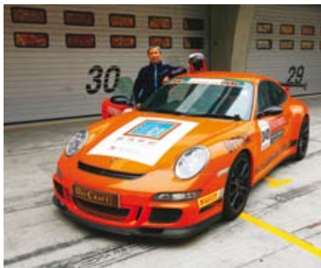
古汝诚和他的911 GT3 RS