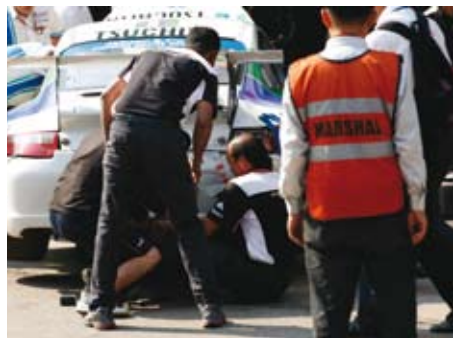
助手为车手排除障碍

在回顾本届系列赛的时候，无论是参赛车手还是车迷，都对这个扣人心弦的赛季给予了极高的评价。在亚太地区车迷的有力支持下，亚洲保时捷卡雷拉杯将继续保持强劲的增长势头。可以预见的是，来年，广大车迷又将迎来一个精彩的赛季。