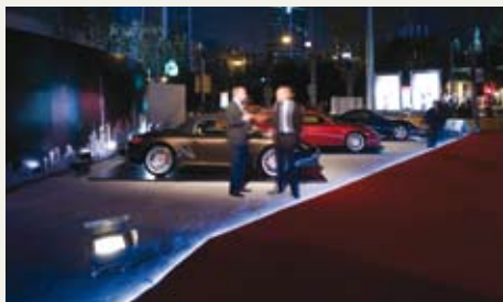
会场入口名车成列