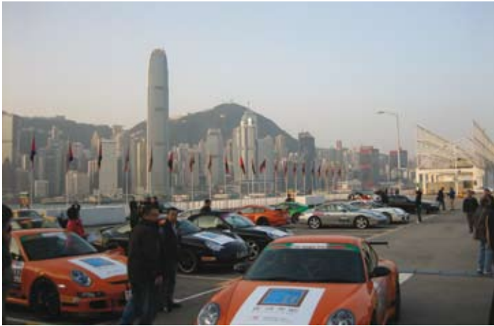
从香港海运码头出发