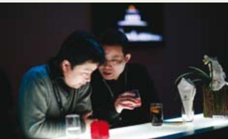
保时捷爱好者互相交流经验