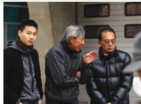
津津乐道于驾驶保时捷的乐趣