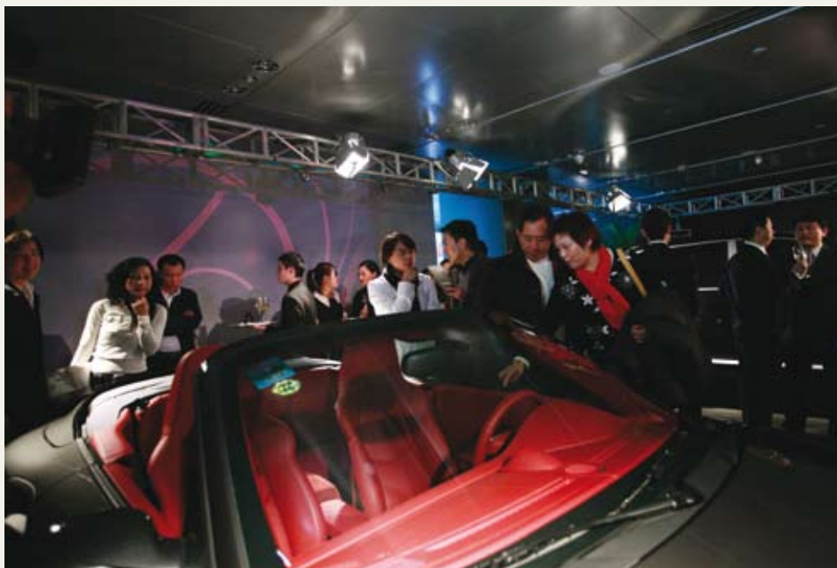
保时捷车迷对新展厅的揭幕热情高涨