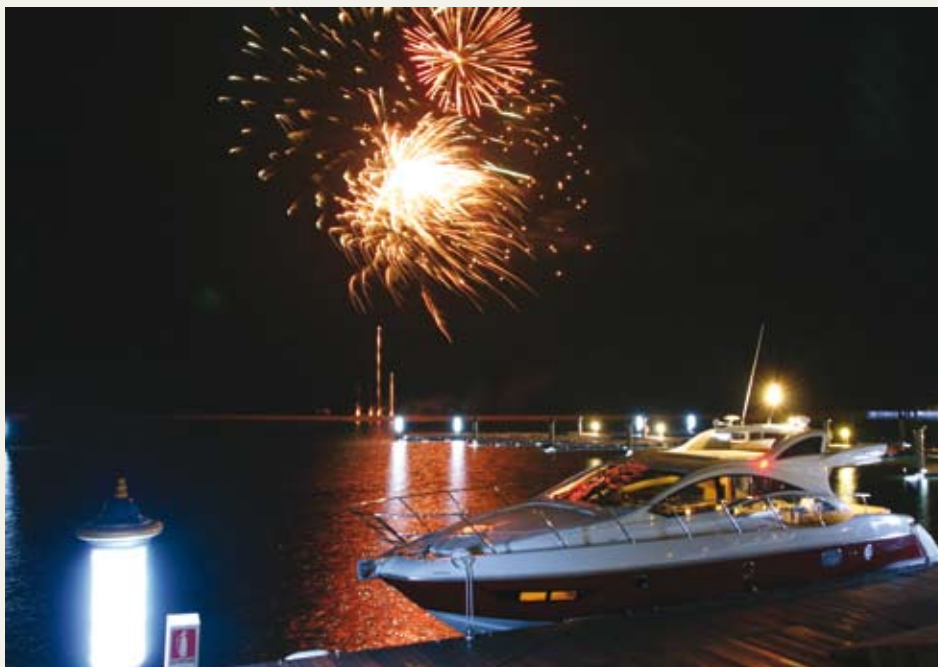
游艇码头边的烟火

游艇俱乐部就像是一个世外桃源，会员即使身着泳装和T恤衫也不会格格不入。再加上独一无二的运动体验，九龙山庄园将会成为一处独领风骚的度假胜地。 ◀