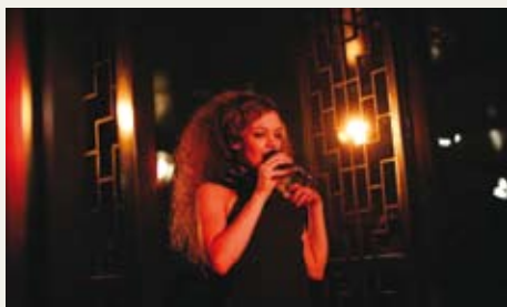
来自德国热情洋溢的声音