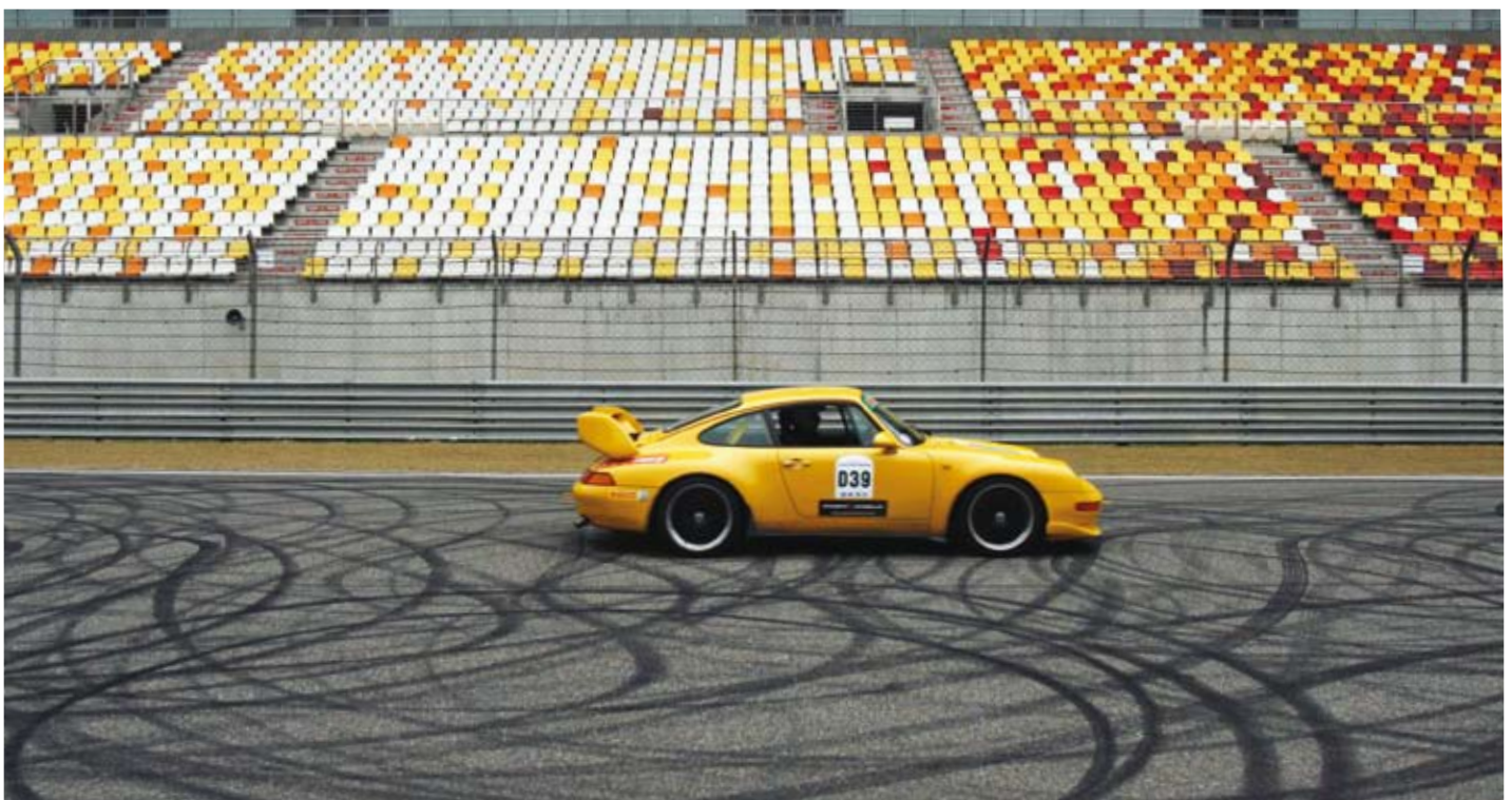
Carrera GT 在赛车场上惊艳亮相

经过数日的驾驶，香港保时捷俱乐部成员抵达了上海，在世茂皇家艾美酒店受到了保时捷中国上海总部的热情接待。出席接风酒会的还有上海保时捷俱乐部的来宾。在轻松的氛围下，两个俱乐部的成员共同交流了彼此的心得，并互相讲述了一路上的见闻。