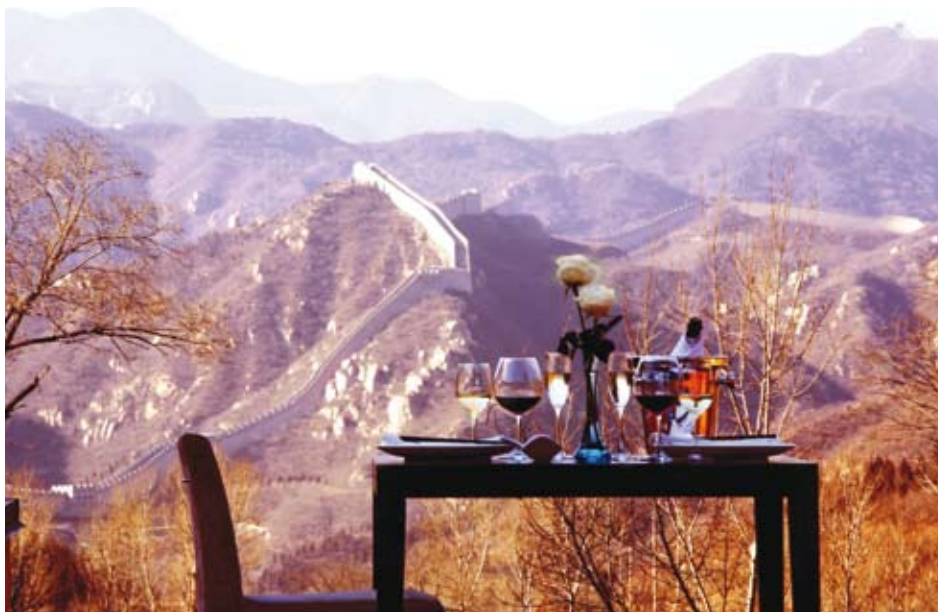
长城脚下的公社凯宾斯基酒店拥有无可匹敌的长城美景

意欲远离喧嚣都市的客人可以参与包括桑拿、按摩、太极拳和瑜伽课程在内的休闲活动, 以此陶冶性情, 修养身心。作为长城脚下的和谐整体、现代建筑艺术的新标杆, 该酒店将会成为游客的明智选择。