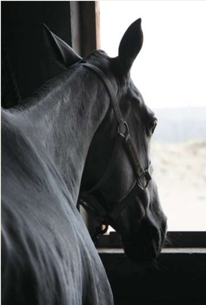
马匹在九龙山马会得到专家的悉心呵护

马球在中国有着悠久的历史，随着经济的迅速发展和新贵阶层的崛起，这项贵族运动卷土重来，高级马球会所也如雨后春笋般出现，浙江嘉兴平湖的九龙山马会俱乐部便是其中的佼佼者。