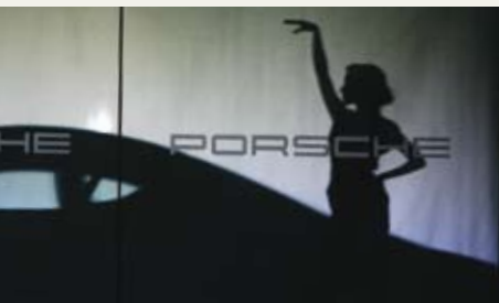
来自上海的舞者婀娜的身影