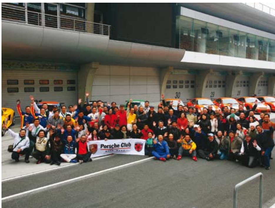
一同为保时捷欢呼

壮大，在继续培养会员和车迷对保时捷品牌热情的基础上，俱乐部还积极参与了当地的慈善事业。