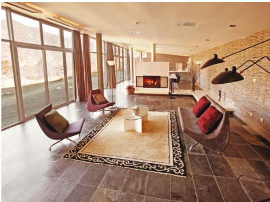
充满艺术气息的建筑公社内饰, 为旅行者提供了一处宁静的休憩之所