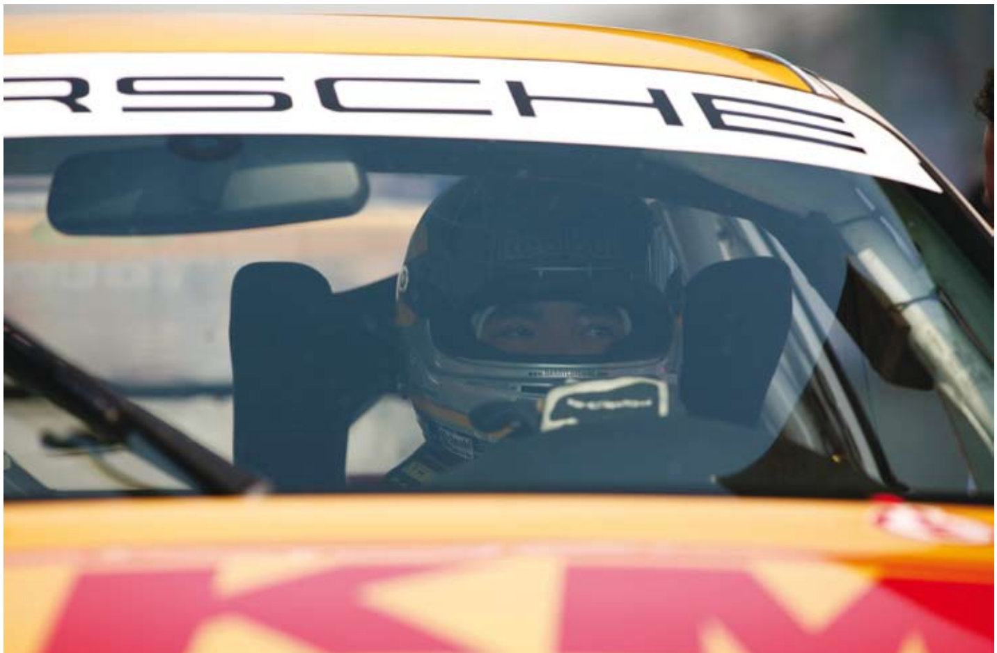
赛车手在观察场地状况