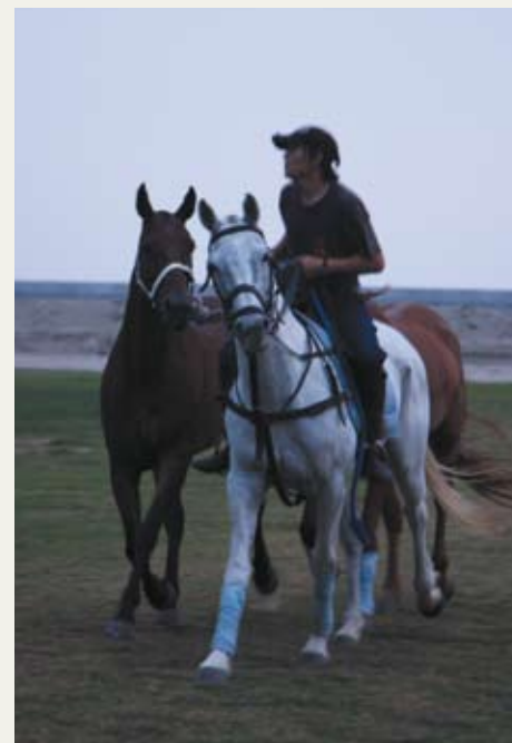
九龙山马会的马匹每天都需要锻炼