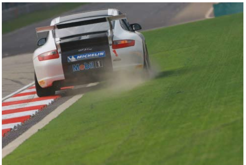
一名赛车手在赛道上留下了痕迹