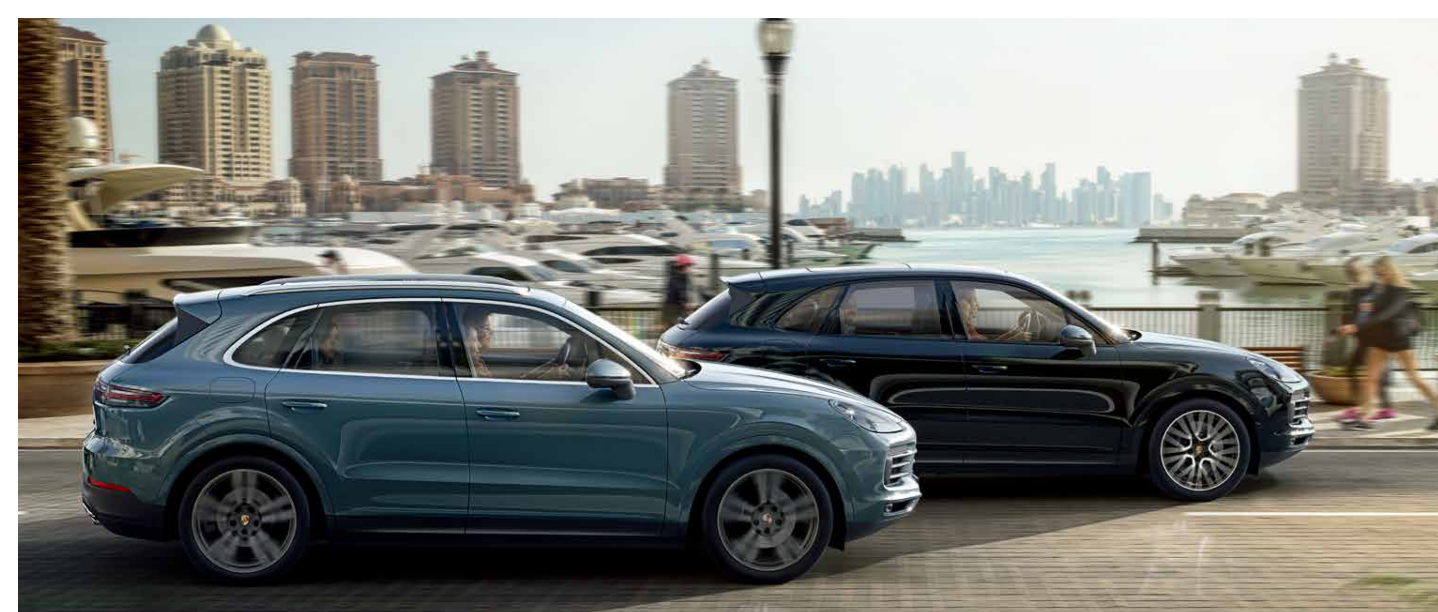
Cayenne S 和 Cayenne