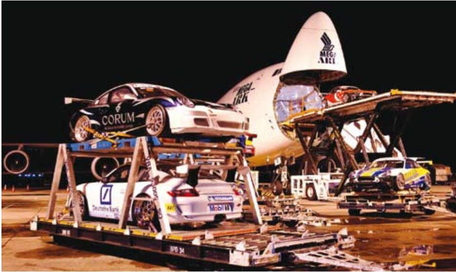
决赛前夕，所有 911 GT3 Cup 赛车空运至巴林