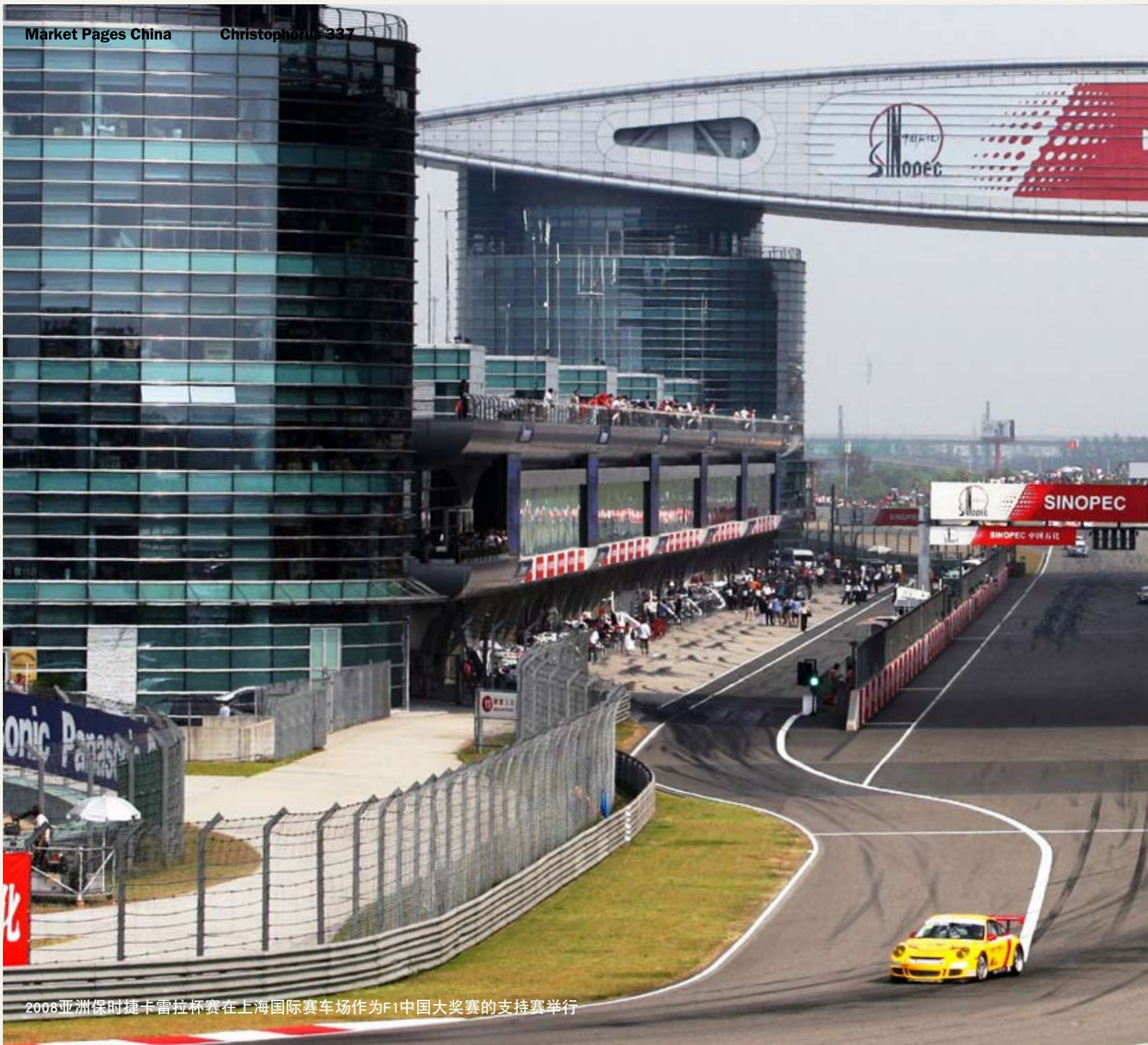
2008亚洲保时捷卡雷拉杯赛在上海国际赛车场作为F1中国大奖赛的支持赛举行